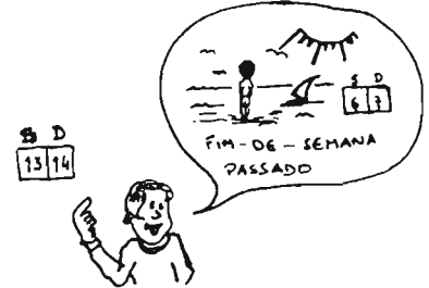
No fim-de-semana passado eu fui à praia.