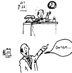
Ontem eu tive muito trabalho no escritório.