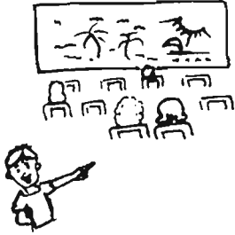
Ontem à noite eles foram ao cinema.